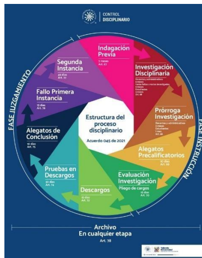
Ilustración 3. Estructura de las etapas del proceso disciplinario art. 78..

Así las cosas, se debe considerar la prevalencia de los principios rectores contenidos en la Constitución Política, las demás normas complementarias, la integración normativa de más tratados y convenios internacionales. Por otra parte, y de acuerdo con lo establecido en la Ley disciplinaria se puede precisar cada una de las etapas procesales en materia disciplinaria como se puede observar en la siguiente imagen: