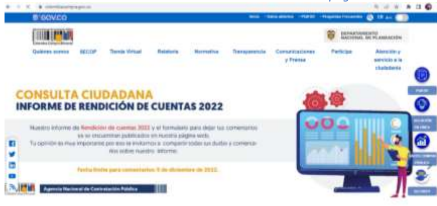
Ilustración 2: Pieza consulta ciudadana en Banner página web

en redes sociales (principalmente Facebook y Twitter) se publicó de manera frecuente las piezas de invitación a la consulta, es importante mencionar que de manera segregada por temáticas se publicaban datos relevantes de gestión y videos, donde se relacionaba el enlace para participar en el respectivo formulario, estas publicaciones se hicieron también mediante historias en Instagram.