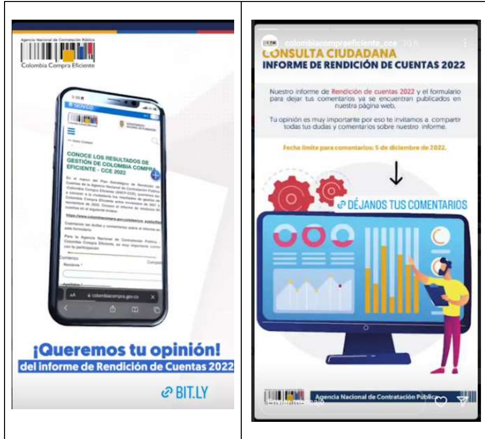
Ilustración 4: Difusión consulta ciudadana historias en Instagram

Consulta desde 21/11/2022 hasta el 05/12/2022