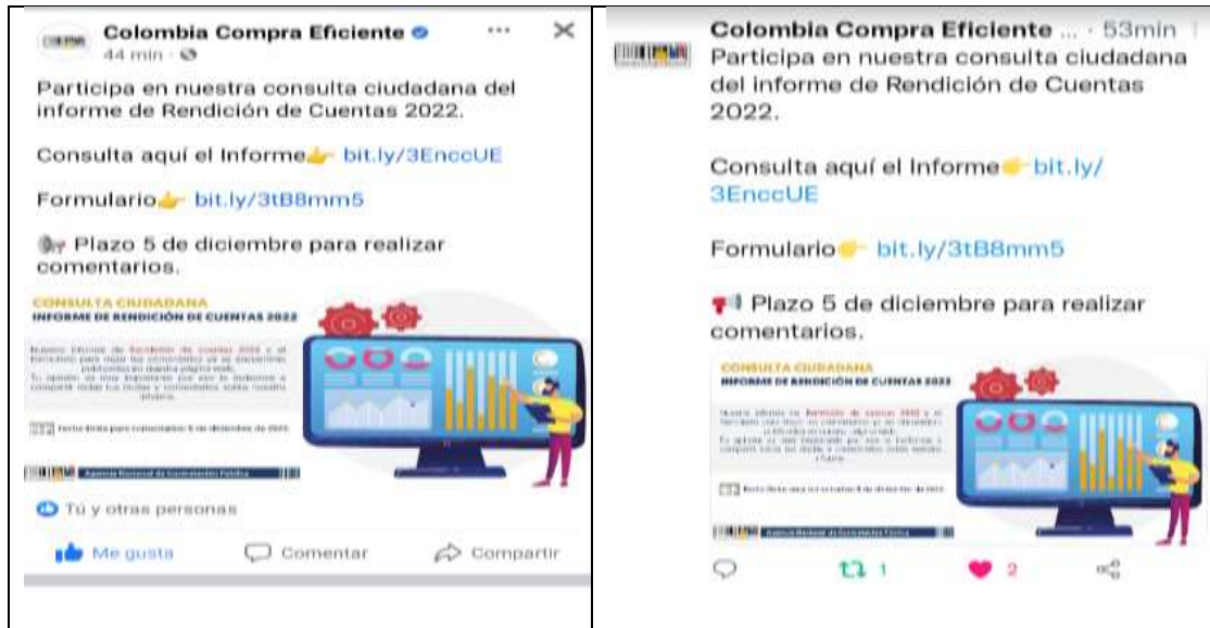
Ilustración 3: Difusión consulta ciudadana en redes sociales