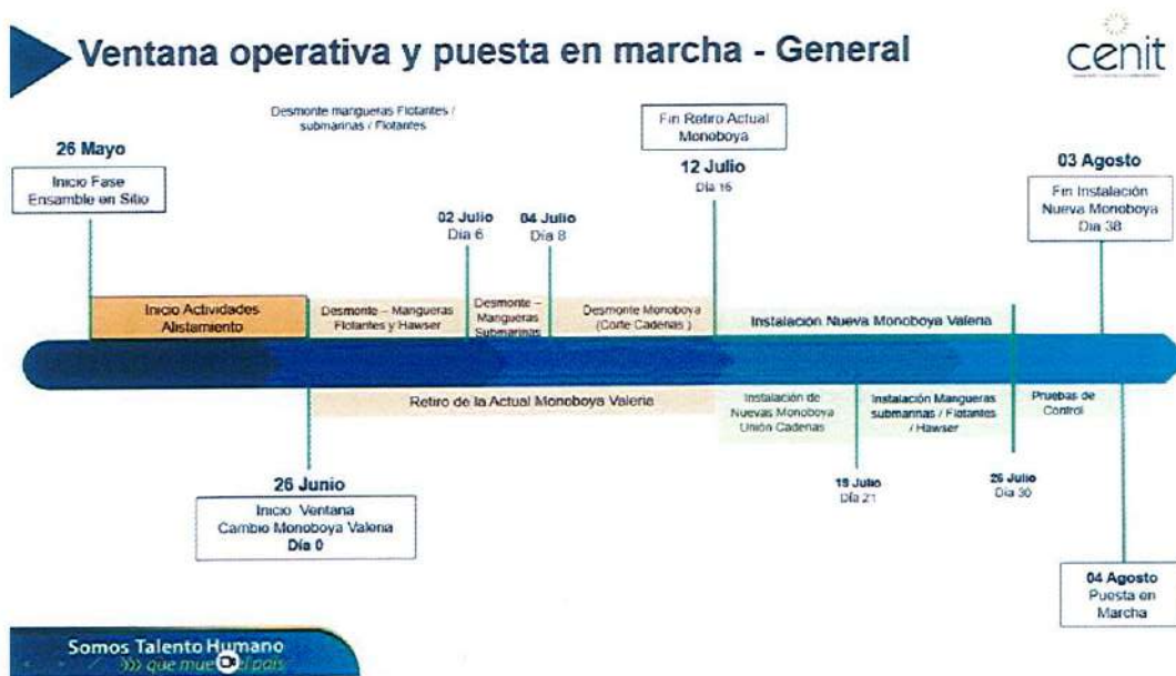
Imagen 1. Cronograma Ventana Operativa

A continuación, se presenta el Plan Maestro de Trabajo puesto en conocimiento de la ANI en diferentes espacios de reunión adelantados con CENIT y que, incluye el detalle de las actividades a ejecutar para el retiro de la monoboya actual e instalación de la nueva monoboya, con fecha de inicio el 26 de junio de 2024 y primera operación de descargue el 04 de agosto de 2024: