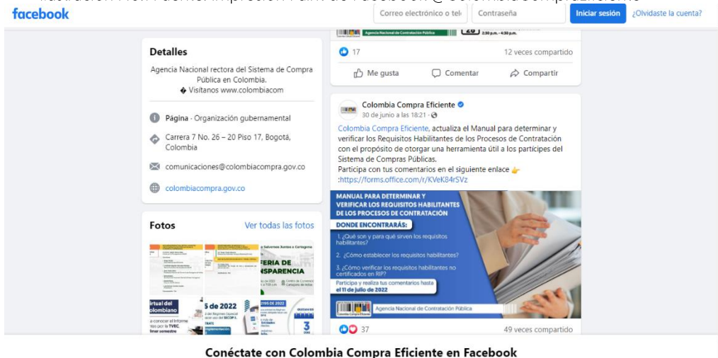
Conéctate con Colombia Compra Eficiente en Facebook