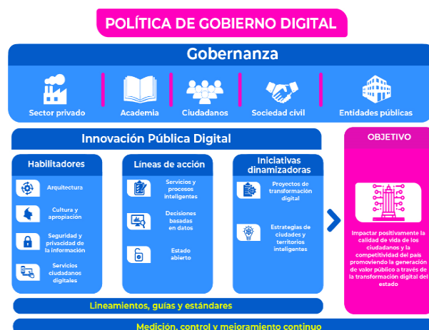
Grafica 1. Esquema Política Digital 2018 – 2022 Decreto 767 de 2022