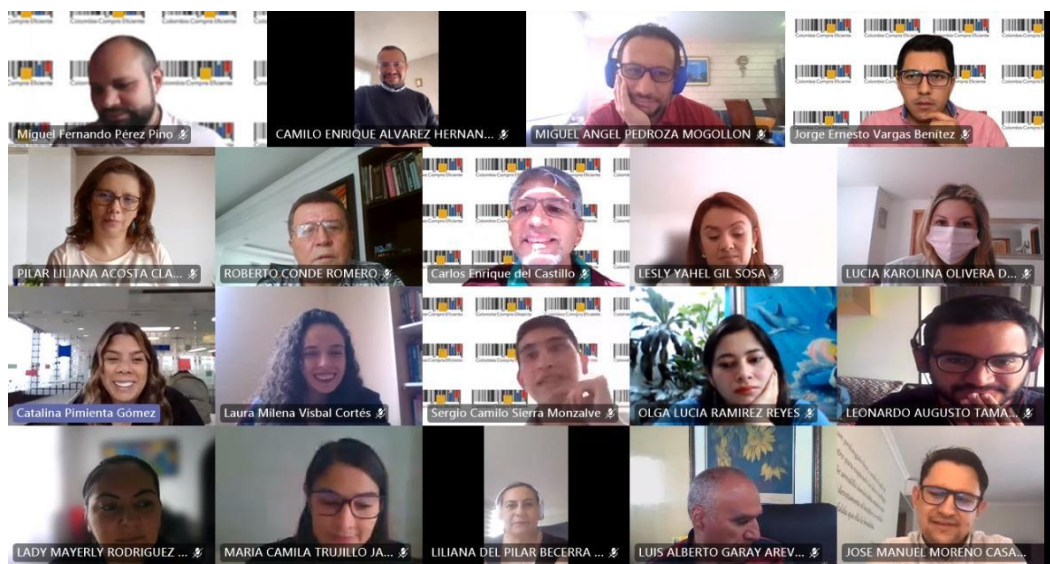
Ilustración 1. Capacitación de formación con el Ministerio de Minas y Energía

La actividad de formación con el Ministerio de Minas y Energía se adelantó, a través de 11 sesiones cualificativas que contaron con la participación de 43 asistentes debidamente certificados, a partir del día 16 de abril de 2021 hasta el 21 de mayo de 2021.