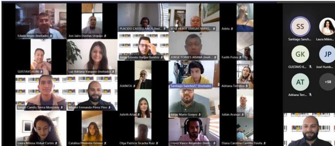
Ilustración 2. Capacitación de formación con la alcaldía de Palmira

La actividad de formación con la Gobernación de Cundinamarca se adelantó, a través de 16 sesiones cualificativas que contaron con la participación de 35 asistentes debidamente certificados, a partir del día 06 de julio de 2021 hasta el 11 de agosto de 2021.