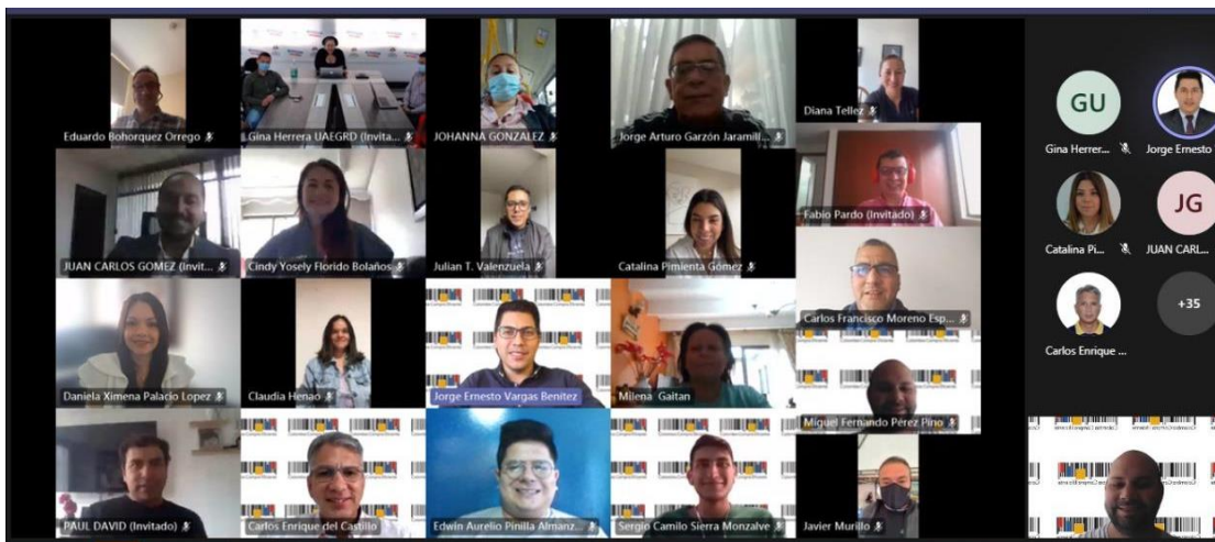
Ilustración 3. Capacitación de formación con la Gobernación de Cundinamarca

La actividad de formación con la Gobernación de Cundinamarca se adelantó, a través de 16 sesiones cualificativas que contaron con la participación de 35 asistentes debidamente certificados, a partir del día 06 de julio de 2021 hasta el 11 de agosto de 2021.