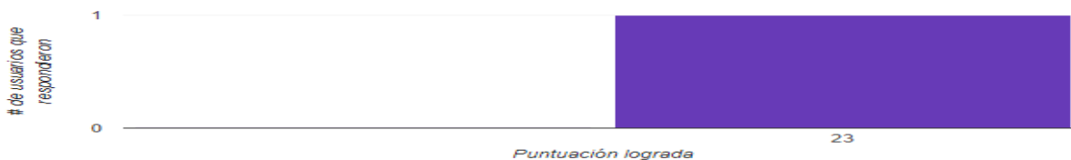
Distribución de puntos totales