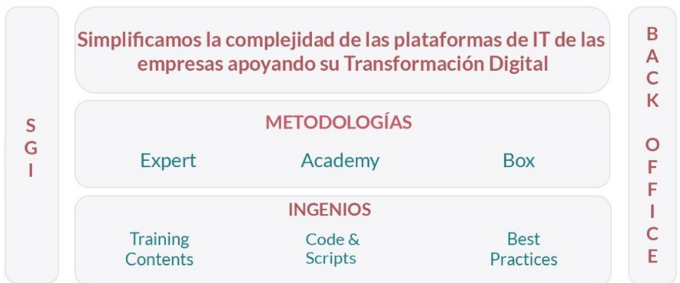
Gráfico 04: Modelo de Negocio BMind®

Somos especialistas en plataformas de software empresarial a nivel de: Datos, Infraestructura y Capa Media. Contamos con tres Líneas de Negocio apalancadas en una metodología específica para su ejecución: