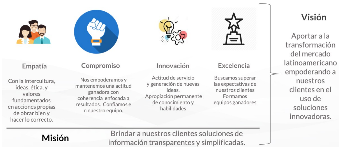
Gráfico 01: Misión, Visión y Valores de BMind®

BMind® es una empresa orientada a entregar a sus clientes soluciones de tecnología que ayuden a transformar sus organizaciones y les permitan construir nuevos modelos de negocios, utilizando tecnologías de punta que contribuyan a la reducción costos y eficiencia en sus procesos.