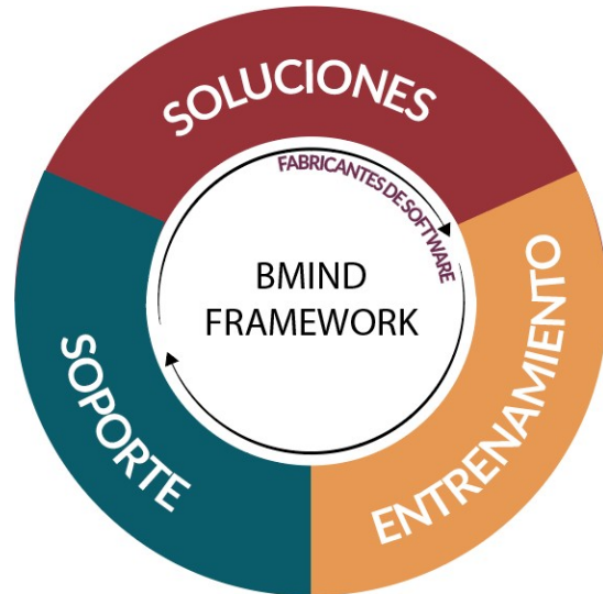
Gráfico 03: Portafolio de BMind®

Somos especialistas en plataformas de software empresarial a nivel de: Datos, Infraestructura y Capa Media. Contamos con tres Líneas de Negocio apalancadas en una metodología específica para su ejecución: