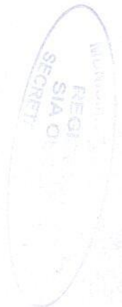
Firma Representante Legal

Dado en Bogotá a los 30 días del mes de Enero de 2023.