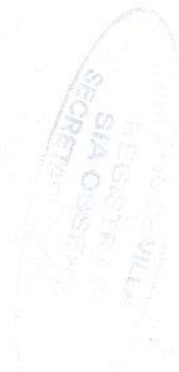
Firma Representante Legal

Dado en Bogotá a los 24 días del mes de Febrero de 2023.