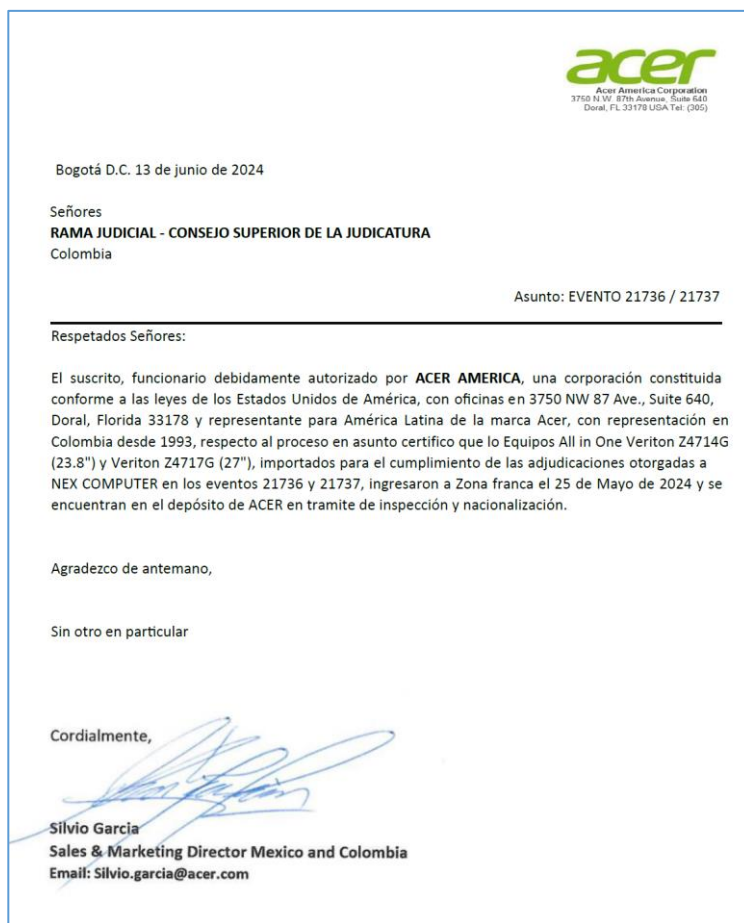
Carta del fabricante ACER

En su solicitud de prórroga, el contratista presenta el siguiente cronograma para ambas órdenes de compra, que incluye las actividades ya culminadas, así como las fechas que se actualizarían: