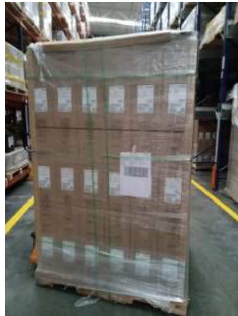
Fotografías de algunos de los equipos de las órdenes de compra 123472 y 123475; la totalidad de estos ya están en la bodega del fabricante en Zona Franca

Como responsables de garantizar la correcta entrega de los equipos, es importante informarles que estamos, experimentando demoras en la inspección y nacionalización de los equipos en Zona Franca, ya que ese proceso debió finalizar el 7 de junio de 2024.