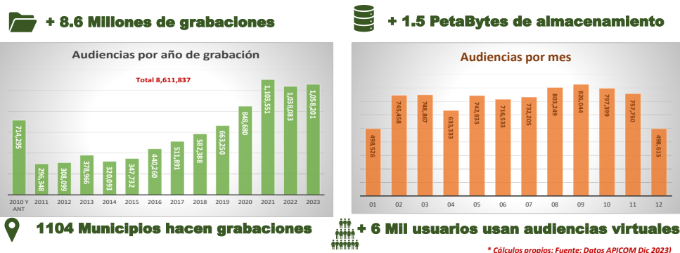
Gráfica 2. Grabaciones de audiencias por año. Fuente: Base de datos APICOM - diciembre 2023

Desde 2019, se observa un aumento significativo en la realización de audiencias virtuales en los despachos de las diversas jurisdicciones y especialidades de la Rama Judicial, la normativa vigente y los recientes decretos y leyes favorecen y facilitan el uso de la virtualidad para ampliar el acceso de los usuarios a los servicios de justicia, utilizando las Tecnologías de la Información y las Comunicaciones (TIC).