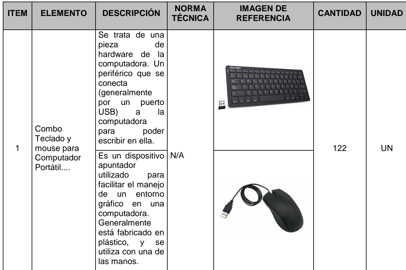
IMAGEN REFERENCIA: Ilustración grafica del periférico que representa el requerimiento. (La ilustración no es una referencia)