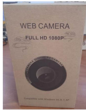
Foto del catálogo de la marca DIGITECH PRO AWC700 FULL HD