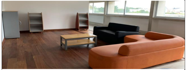
FOTO 2 - Mesa Auxiliar - Configuración 2 - Modulo Auditorio - Mesanine Costado Sur - Colección Especializada