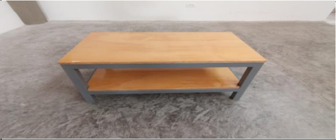
FOTO 3 - Mesa Auxiliar - Modulo Auditorio - Mesanine Costado Norte - Colección General