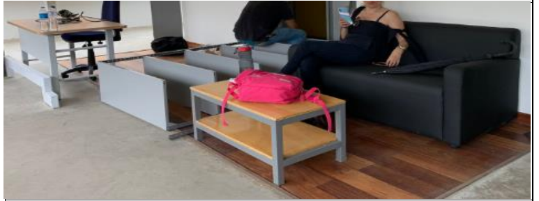
FOTO 4 - Mesa Auxiliar - Modulo Auditorio - Piso 2 - Recepción