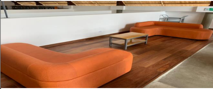
FOTO 1 - Mesa Auxiliar - Modulo Auditorio - Mesanine - Salas Virtuales