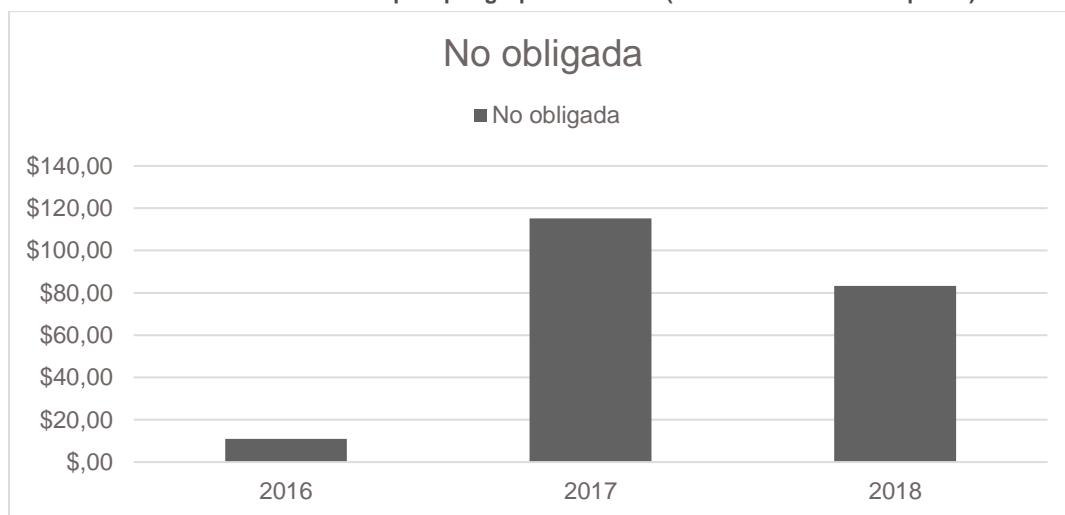
Gráfica 1 - Histórico de compras por grupo de Entidad (valores en millones de pesos)