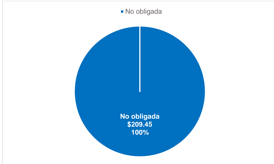
Gráfica 2 Resultados por grupo de Entidad Compradora (valores en millones de pesos)