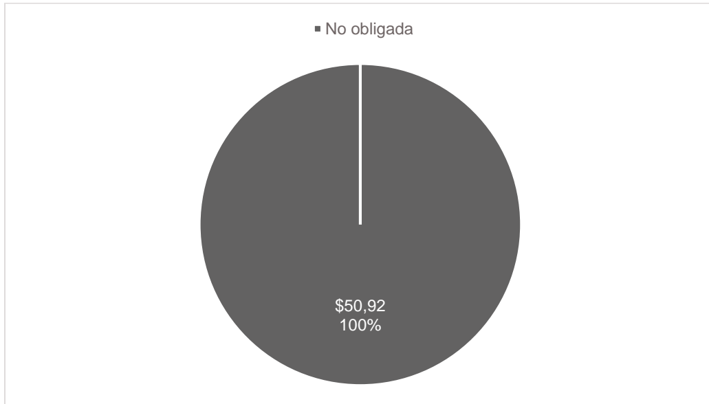
Gráfica 2 Resultados por grupo de Entidad Compradora (valores en millones de pesos)